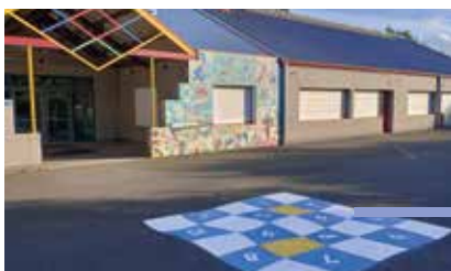
Jeux de cour à l'école publique