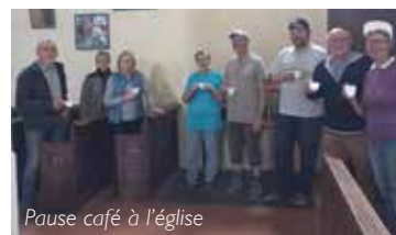
Pause café à l'église