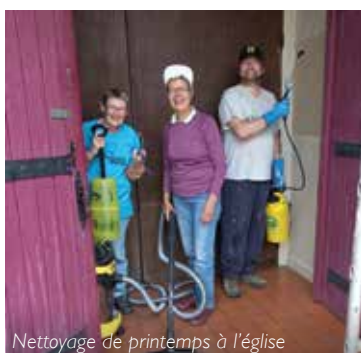
Nettoyage de printemps à l'église