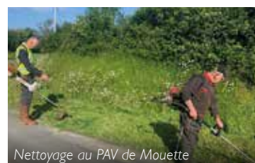
Nettoyage au PAV de Mouette