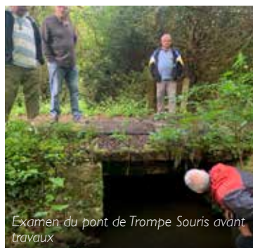
Examen du pont de Trompe Souris avant travaux