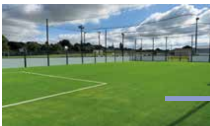
Nouveau terrain de football synthétique