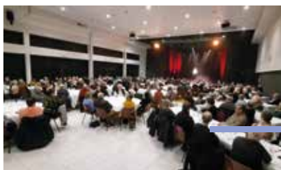
Soirée cabaret (27 janvier 2024)