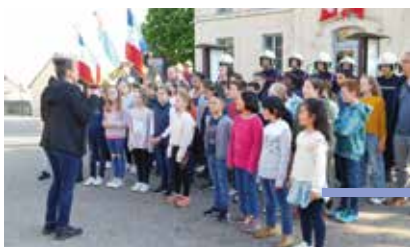
Cérémonie commémorative (8 mai 2024)