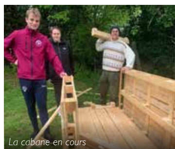
La cabane en cours

Grand merci à tous les bénévoles avec ce bel état d'esprit porteur de valeurs.