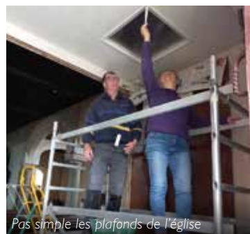
Pas simple les plafonds de l'église