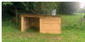
Photo des chèvres : boucs castrés L'idée de créer un circuit de randonnée spécifique Eco pâturage prend forme ! Nous allons finir par

manquer d'animaux ! Pour information, cette année nous réservons la parcelle derrière la mairie pour faire notre propre foin.