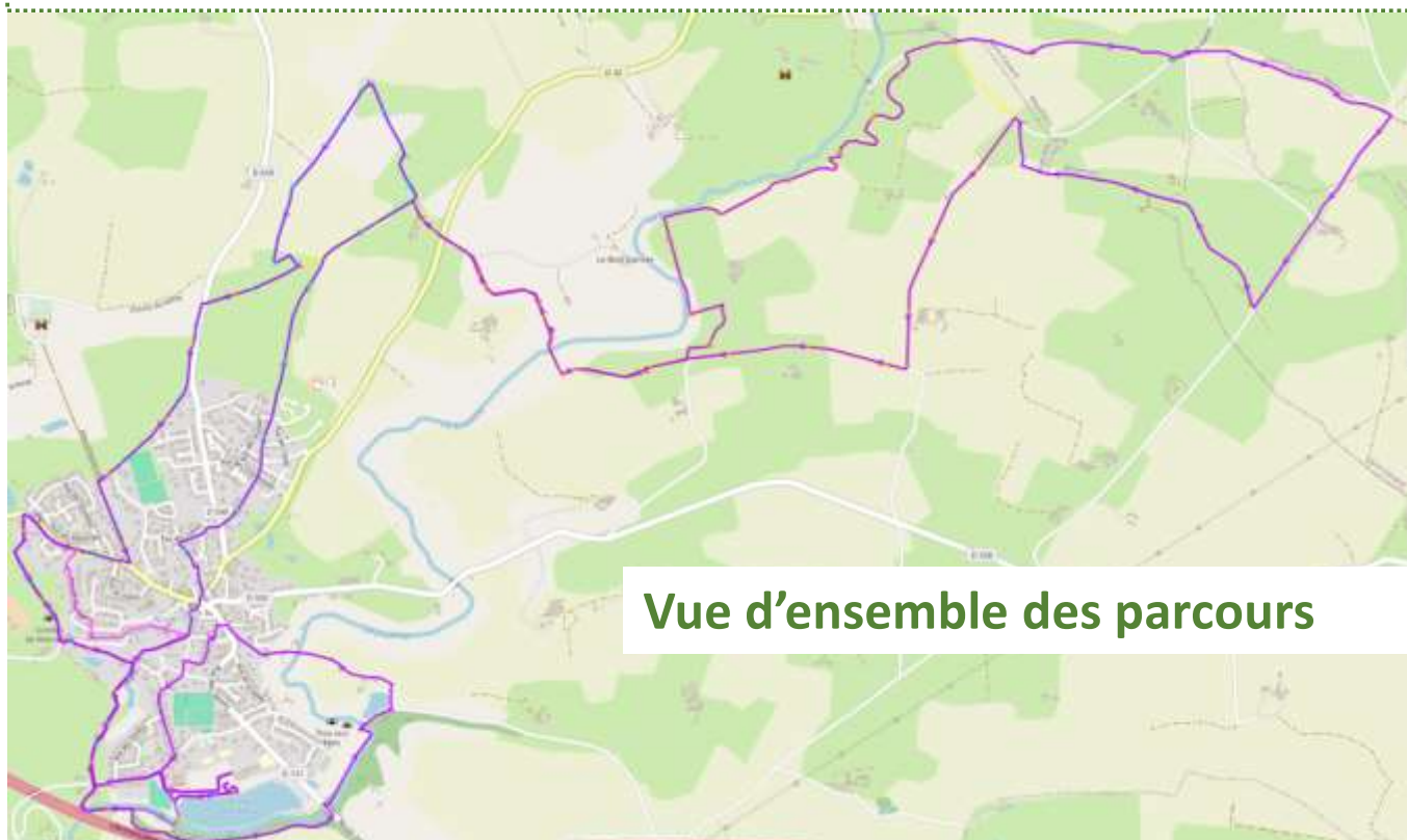
Vue d'ensemble des parcours